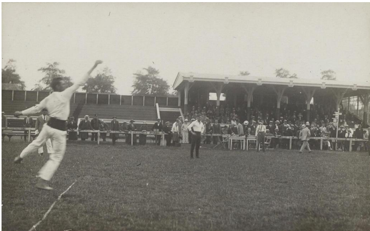
Kaatswedstrijd op het Sportpark, collectie regionaal archief Alkmaar (Hollandia fotobureau) geschat jaar 1926, maar mogelijk is dit de wedstrijd van 1923 gezien het aanwezige publiek

De weersomstandigheden werkten niet mee: er heerste een hittegolf. Zondagmiddag om half 2 toen de wedstrijd zou beginnen was er een ware wolkbreuk. Door de hevige regen begon de wedstrijd een uur later. Het aantal toeschouwers werd geschat op 500 personen, waaronder zeer veel Friezen uit Alkmaar.