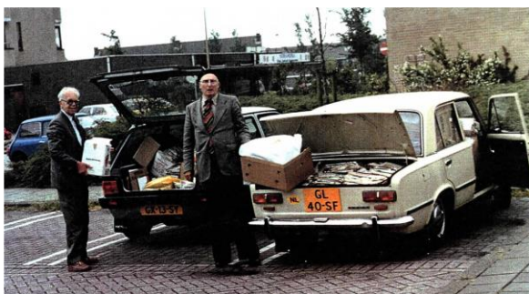
Oud papier ophalen