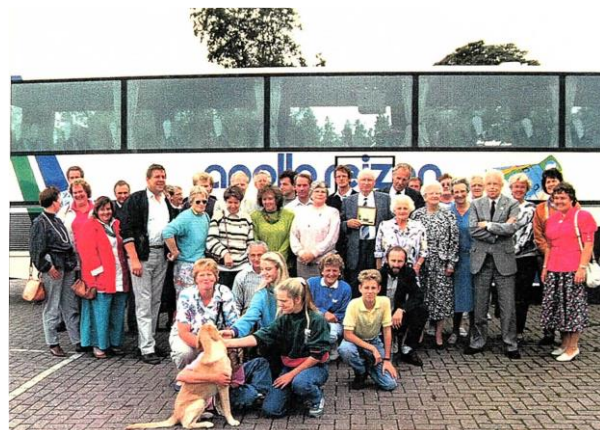
Afsluitende verrassingstocht jubileumjaar 1989